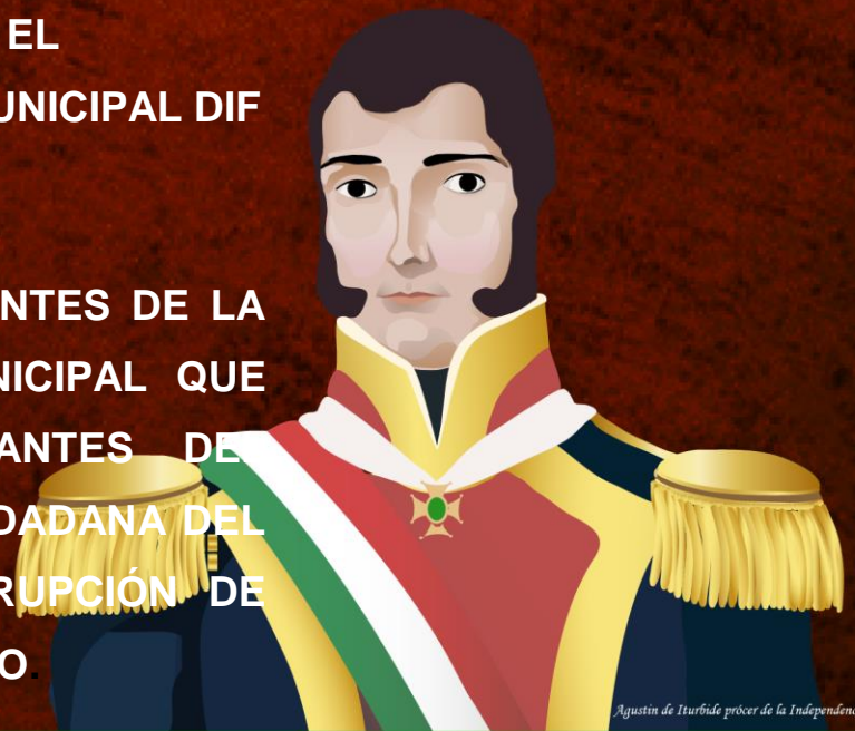
Agustín de Iturbide prócer de la Independencia de México.